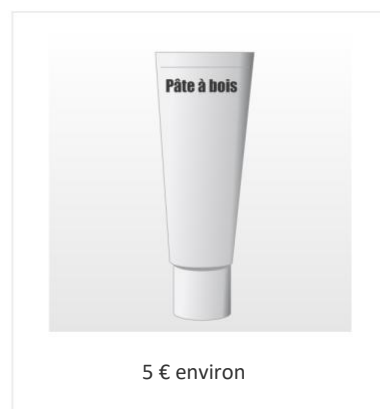
Pâte à bois