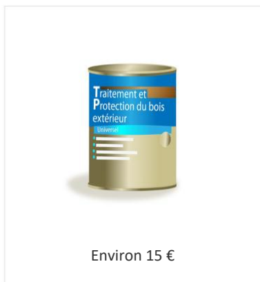
Traitement spécial bois extérieur