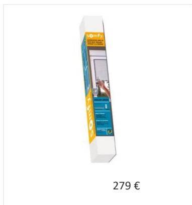
Pack Roller drive Somfy