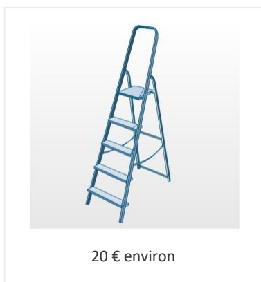
Escabeau / échelle