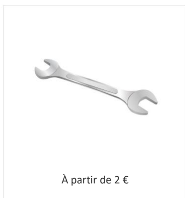
Clé de 8