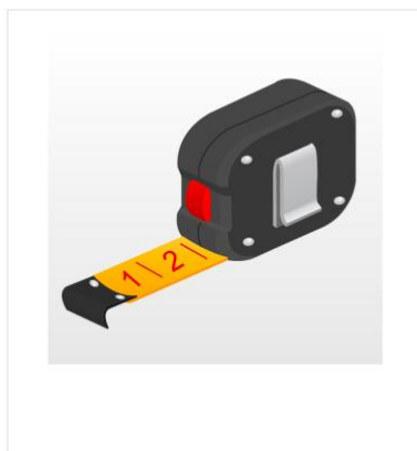
Mètre à ruban