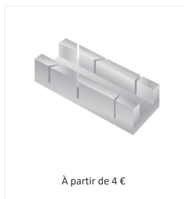
Boite à onglet