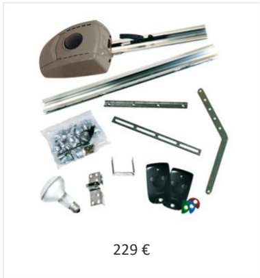
Kit de motorisation GDK 3000 Somfy