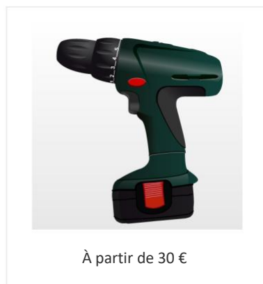
Perceuse + forets de 3 et 8 mm