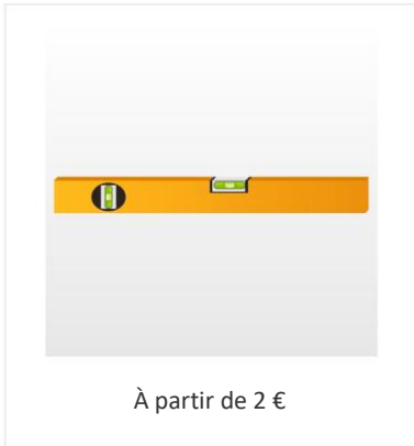
Niveau à bulle