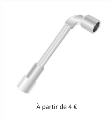
Clé à pipe de 8 et 10 mm